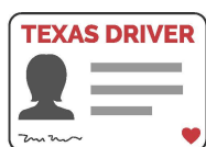
Licencia de Conducir de Texas*