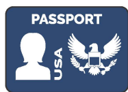
Pasaporte de EE. UU.* (Libro o Tarjeta)