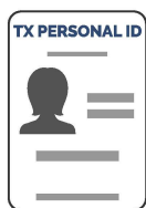
Tarjeta de Identificación Personal de Texas*