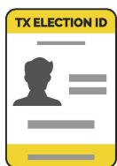
Certificado de Identificación Electoral de Texas*