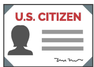
Certificado de Ciudadanía de EE. UU. con Fotografía